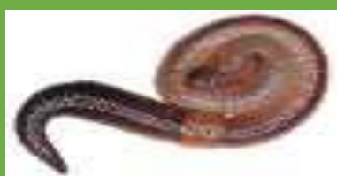
Ver de terre