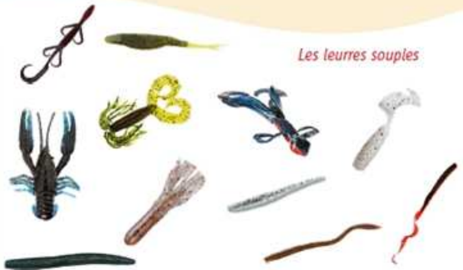
Les leurres souples